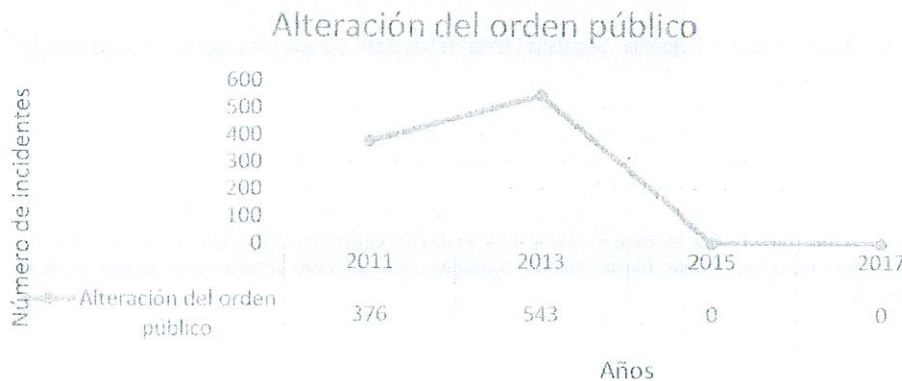
Gráfico 3. Alteración en el orden público en Bogotá D.C. entre enero de 2010 y el 4 de octubre de 2017 con interviniente barrista o hincha del fútbol

La variable de alteración del orden público, representada en el Gráfico 3, presenta cifras iguales a cero (0) para los años 2015 y 2017, contrario al año 2013 que presentó un total de 543 incidentes de