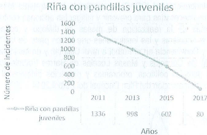
Gráfico 2. Riña con pandillas juveniles en Bogotá D.C. entre enero de 2010 y octubre de 2017 con interviniente barrista o hincha del fútbol.

Dentro del reporte de riñas con pandillas juveniles, se presenta un total de 1.336 incidentes en el año 2011 con respecto a 80 reportes en el año 2017, evidenciando una disminución del 94%, como lo muestra el Gráfico 2. Para el año 2015, se presentan 602 reportes, reflejando una disminución del 86,7% en los dos últimos años.