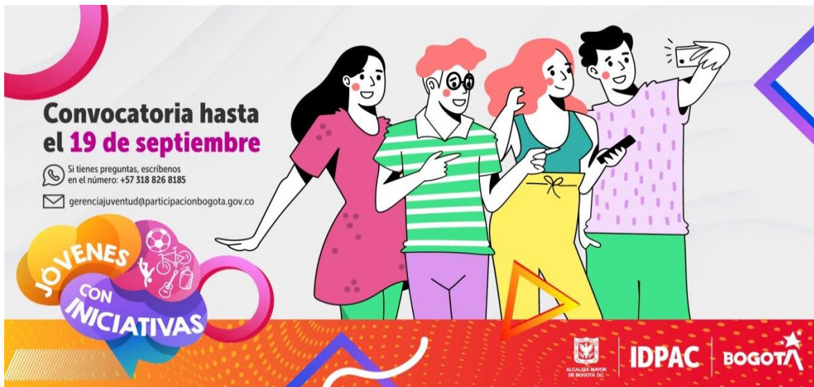
Ilustración 8. Convocatoria Jóvenes con iniciativas

Para ello, se suscribió el convenio 616 de 2021 entre la Organización de Estados Iberoamericano – OEI e IDPAC, para entregar los incentivos de fortalecimiento a las organizaciones sociales, en la localidad de Chapinero, se entregó incentivos a cuatro (4) organizaciones juveniles: