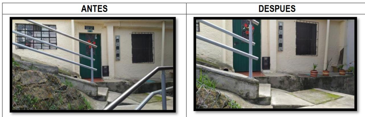
Fotografía 2. Participación Ciudadana Obra de Sostenibilidad Chapinero 2021