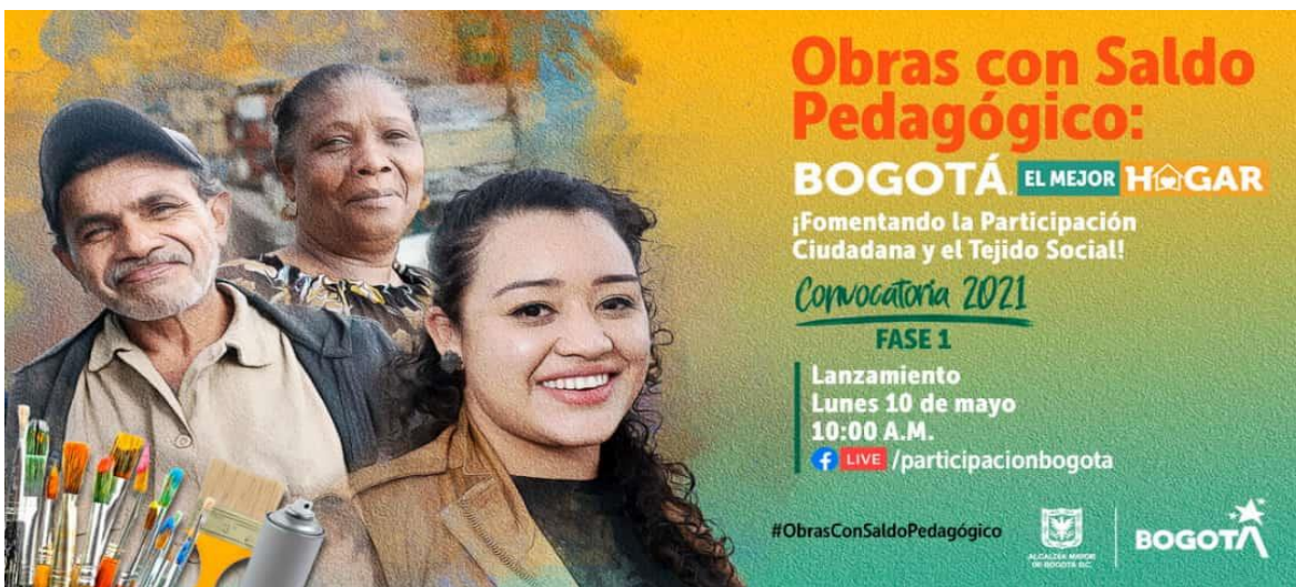
Ilustración 5. Pieza publicitaria Convocatoria OSP 2021

Igualmente, se realizó el acompañamiento técnico y social para la entrega de las Obras con Saldo Pedagógico para el Cuidado y la Participación Ciudadana que resultaron seleccionadas en el