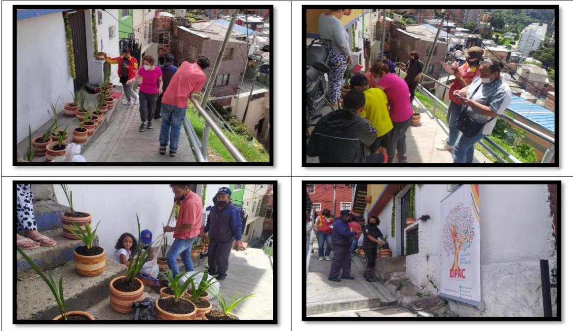
Anexo 17. Informe de sostenibilidad OSP “Baranda Rampa Escalonada” Chapinero

Durante 2021, el IDPAC publicó oficialmente la convocatoria para las Obras con Saldo Pedagógico: “Bogotá, el Mejor Hogar”, implementando la estrategia de difusión virtual y presencial y los diferentes canales de comunicación, atención y seguimiento a las dudas y preguntas de las Juntas de Acción Comunal y ciudadanía en general interesada en participar de esta convocatoria.