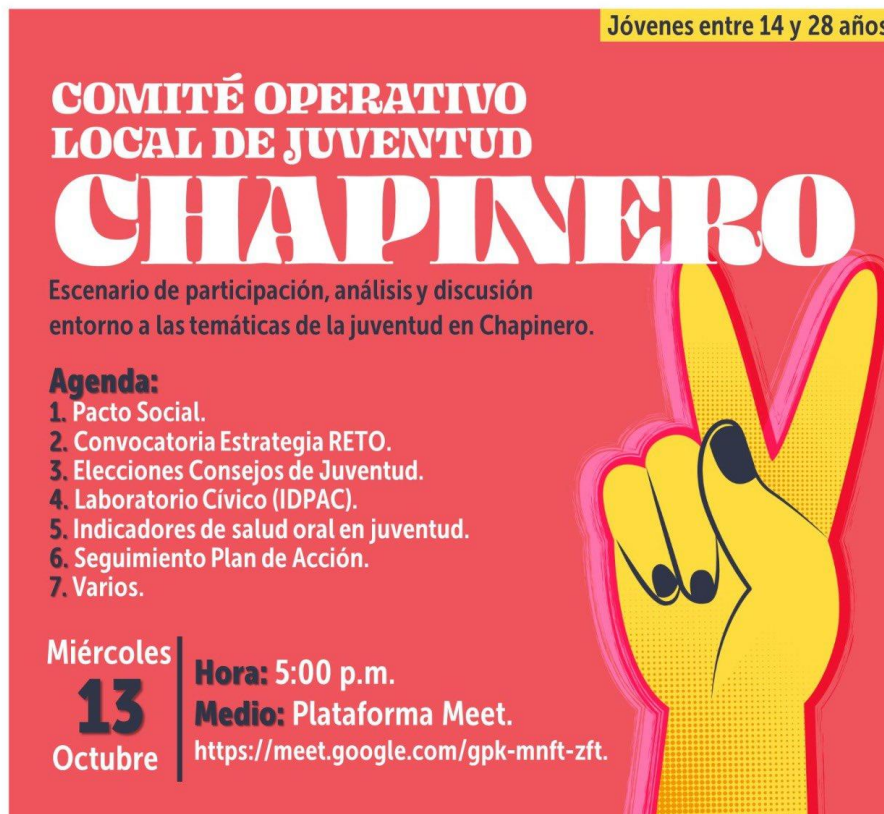
Ilustración 9. Invitación Comité Operativo Local Juvenil de Chapinero

Elaboró: Juan Pablo Aldana – Silvia Milena Patiño León – Contratistas Oficina Asesora de Planeación