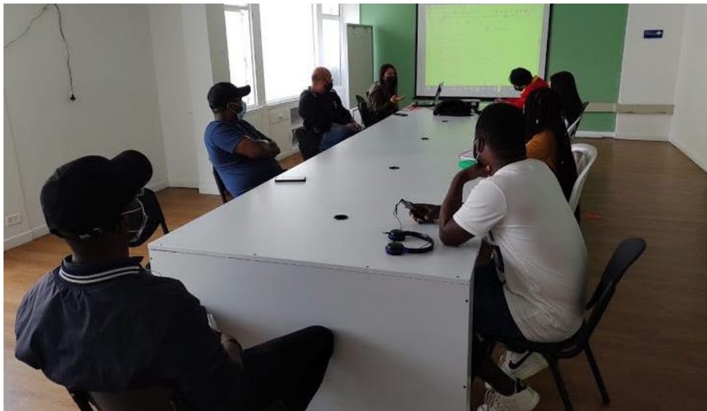
Ilustración 1. Sesión de acompañamiento a instancia NARP de Chapinero.

En el marco de la implementación del modelo de fortalecimiento a las instancias de participación de las comunidades étnicas, el IDPAC realizó asesoría técnica para apoyar el proceso de elecciones de las Comisiones Consultivas de comunidades NARP a través de sesiones virtuales con enfoque étnico. Se contó con dos (2) sesiones de acompañamiento al proceso de comisión consultiva local NARP de la localidad de Chapinero. Las sesiones contaron con la participación de representantes del Instituto Distrital de la Participación y Acción Comunal, de la Secretaría Distrital de Integración Social, líderes afro, la Subdirección de Asuntos Étnicos de la Secretaría Distrital de Gobierno, la alcaldía local de Chapinero y la Subred Norte del Distrito, entre otros representantes.