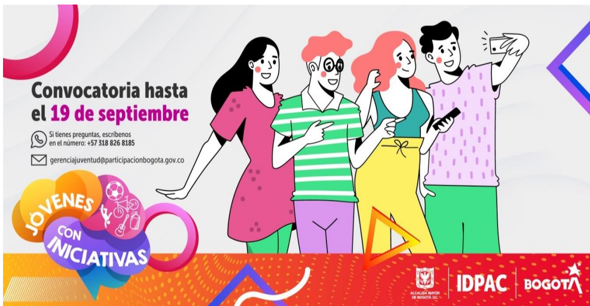
Ilustración 7. Convocatoria Jóvenes con iniciativas

Para ello, se suscribió el convenio 616 de 2021 entre la Organización de Estados Iberoamericano – OEI e IDPAC, para entregar los incentivos de fortalecimiento a las organizaciones sociales, en la localidad de Antonio Nariño, se entregó incentivos a tres (3) organizaciones juveniles: