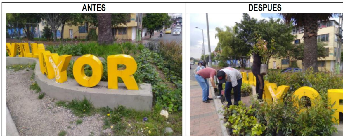
Fotografía 1. Comparativo Físico Obra de Sostenimiento Antonio Nariño

Adicionalmente, y con el fin de promover la participación ciudadana en torno a la apropiación y el cuidado de los territorios, se desarrollaron las Obras con Saldo Pedagógico -OSP- 2021 y se ejecutaron las acciones de sostenibilidad en la OSP 2020 de la localidad de Antonio Nariño, denominada “Recuperación Triangulo Peatonal de la Transversal 33 con Calle 37 Sur”. La obra fue desarrollada en el barrio Villa Mayor, de la UPZ Restrepo.