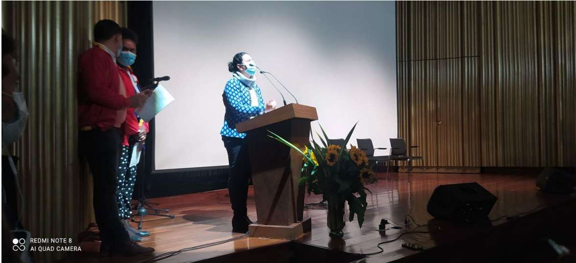
Ilustración 2. Divulgación Instalación Mesas Locales Víctimas Redes Sociales