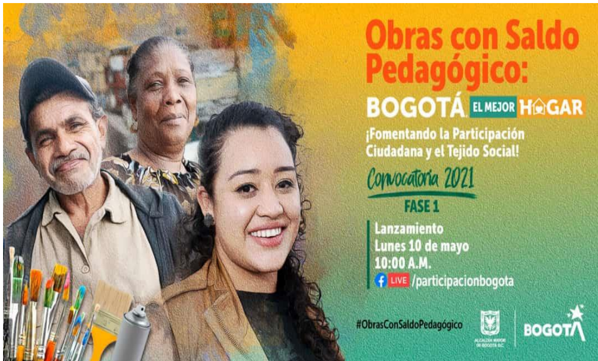
Ilustración 4. Pieza publicitaria Convocatoria OSP 2021