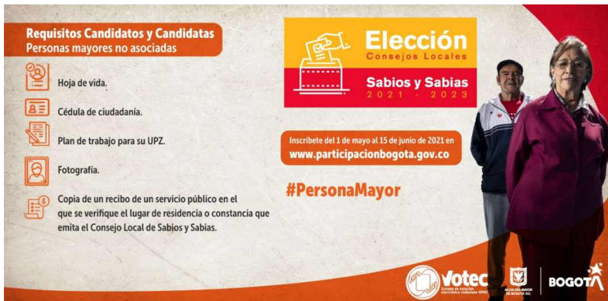
Ilustración 2. Consejo Local de sabios y sabias

Asimismo, se realizó revisión y subsanación de documentos de votantes y candidatos inscritos en el proceso electoral del Consejo Local de Sabios y Sabias a través de mesas técnicas.