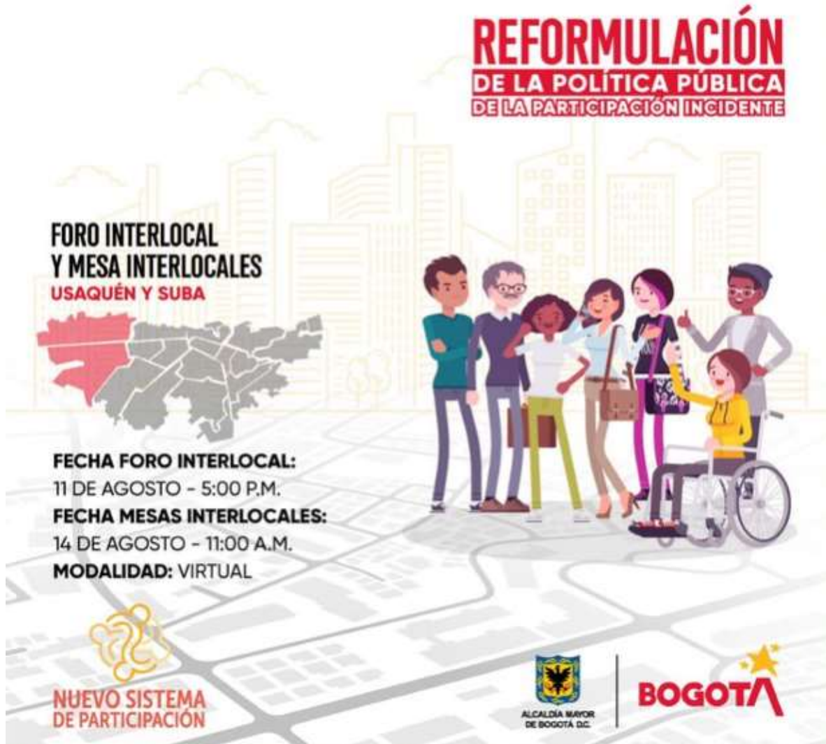
Ilustración 4. Pieza comunicacional – Foro mesa interlocal

Asimismo, en el marco de los procesos de participación ciudadana en temas de ruralidad y construcción de Bogotá-Región que desarrollan en conjunto la Política Pública de Participación Incidente y la Política Pública de Ruralidad, se socializó con la ciudadanía el documento de Diagnóstico y Alternativas de Solución de la Política Pública de Participación Ciudadana.