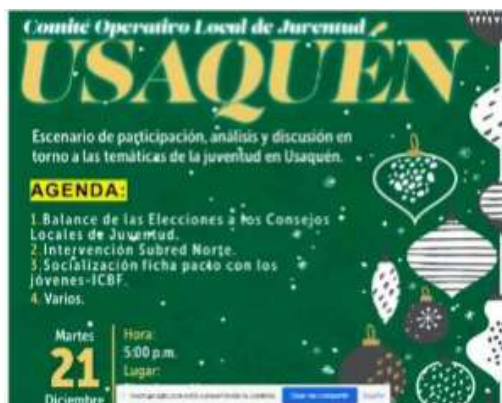
Fotografía 2. Socialización modelo de fortalecimiento instancias COLJ

Se realizó el acompañamiento al Comité Operativo Local de Juventud - COLJ, que corresponde a la instancia de coordinación perteneciente al Subsistema Mixto de participación juvenil entre los meses de abril a noviembre donde se trataron temas relacionados con el modelo de fortalecimiento a las instancias que ofrece el IDPAC, elecciones de Consejos Locales de Juventud, apoyo logístico para eventos, presupuestos participativos, agendas juveniles y socialización de iniciativas juveniles 2021.