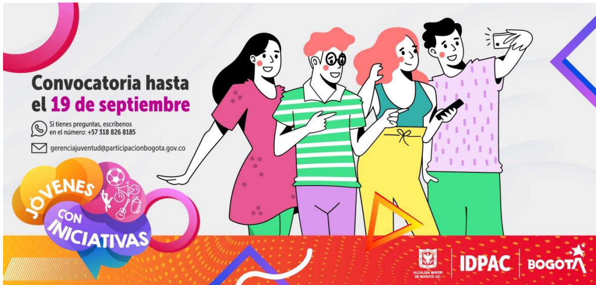
Ilustración 9. Convocatoria Jóvenes con iniciativas

https://www.participacionbogota.gov.co/jovenes-con-iniciativas-2021