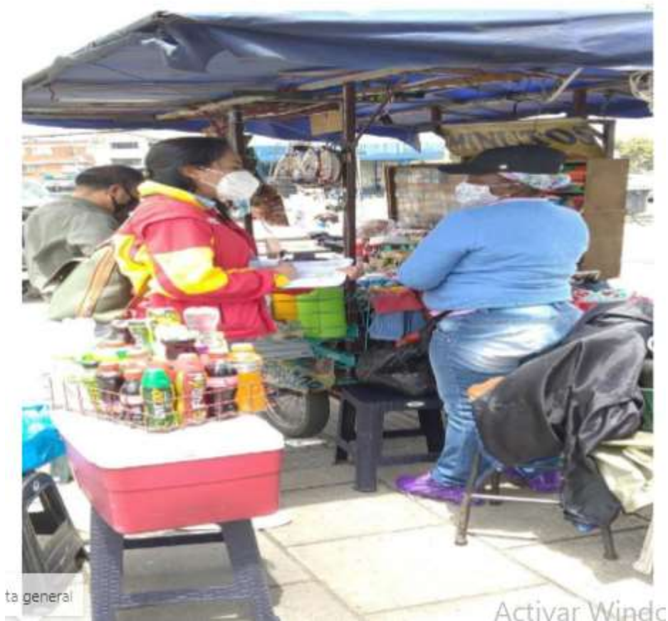
Fotografía 4. Espacios de participación

Se divulgó el portafolio de servicios del IDPAC en formación, promoción y fortalecimiento de la participación, los cuales permitieron a las diferentes organizaciones, ciudadanía y otros actores participar en los diferentes procesos y hacer uso de la oferta institucional como las elecciones locales al consejo de Sabios y Sabias, convocatoria a evento de IDPAC: "Bazar comunitario: La carreta de la participación que no es carreta" y demás oferta institucional así como participar de la semana de la participación