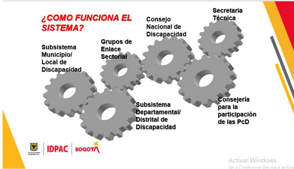
Ilustración 3. Capacitación Consejo Distrital de Discapacidad

Anexo 16. Apoyo elecciones Consejo Distrital de Discapacidad CDD.