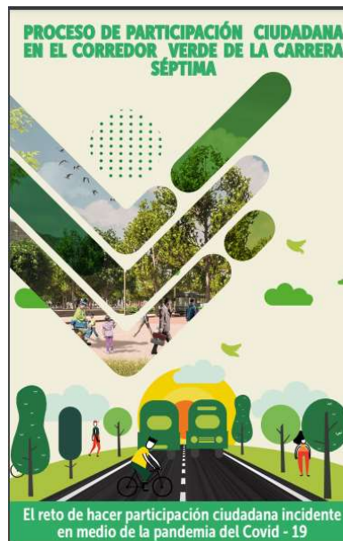
Ilustración 6 Séptima verde

Por otro lado, en cumplimiento de su función de fomentar la cultura democrática y el conocimiento y apropiación de los mecanismos de participación ciudadana y comunitaria, el IDPAC implementó la estrategia 'Pactando', la cual permite espacios de diálogo, escucha, concertación y resolución de conflictos entre la ciudadanía y las Instituciones Distritales - en escalas macro, meso y micro - como instrumento de concreción del 'Nuevo Contrato Social y Ambiental para la Bogotá del Siglo XXI'. En la localidad de Usaquén se promovió el pacto por la defensa de los cerros orientales a través de un pacto interlocal con Usaquén, Chapinero, Santa Fe y San Cristóbal, el pacto por la memoria verbenal y cocreación de la séptima verde.