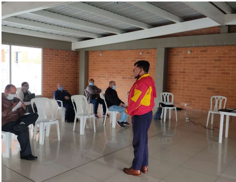
Fotografía 1. Procesos de formación PH