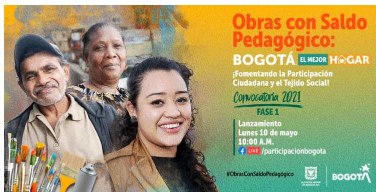
Ilustración 5. Piezas comunicacionales – Obras con Saldo Pedagógico

Luego de las jornadas y reuniones realizadas por el equipo con las JAC de la localidad de Usaquén, se logró el acompañamiento y asesoría a 60 JAC y la inscripción de 31 propuestas a la convocatoria Obras con Saldo Pedagógico: Bogotá, el mejor hogar 2021.