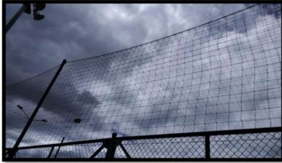
Anexo 26. Obras con Saldo Pedagógico - Sostenibilidad

Adicionalmente, se publicó oficialmente la convocatoria para las Obras con Saldo Pedagógico: Bogotá, el mejor hogar 2021, implementando la estrategia de difusión virtual y presencial y los diferentes canales de comunicación, atención y seguimiento a las dudas y preguntas de las Juntas de Acción Comunal y ciudadanía en general interesada en participar de esta convocatoria.