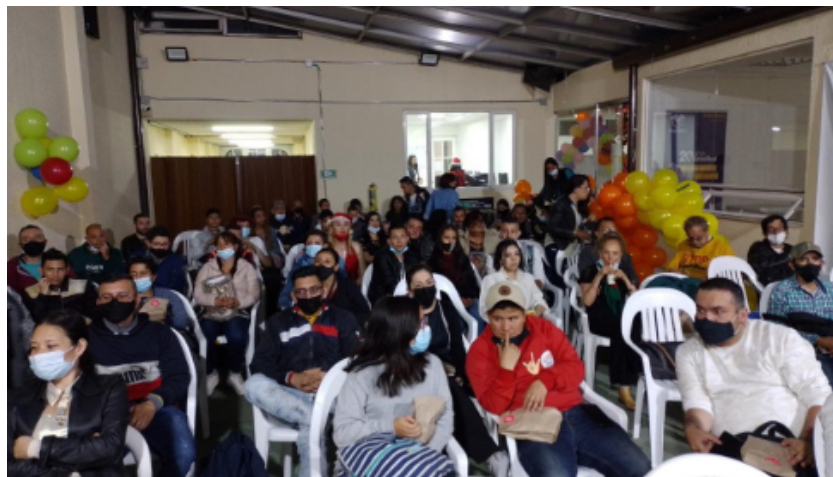
Anexo 16. Acciones LGBTI – Localidad Teusaquillo