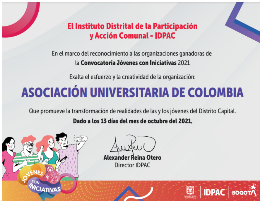
Ilustración 10. Reconocimiento Asociación Universitaria de Colombia

Finalmente, en el marco de la convocatoria Jóvenes con Iniciativas 2021, se realizó el evento de Tejiendo Redes entre los y las Jóvenes, encuentro de jóvenes en el marco de la ceremonia de las noventa y nueve organizaciones ganadoras de la convocatoria Jóvenes con Iniciativas 2021 donde se entregaron diplomas y kit tecnológico a cada representante o líder designado, en la localidad de Teusaquillo la organización ganadora fue "Asociación universitaria de Colombia"