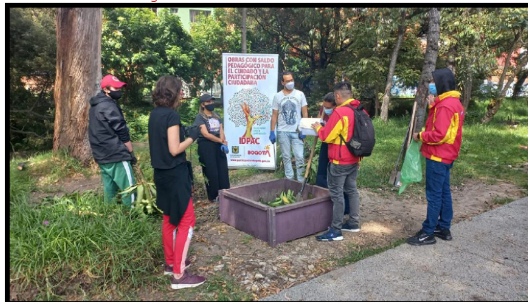
Fotografía 4. Sostenibilidad Barrio Belalcazar

Con el fin de promover la participación ciudadana en torno a la apropiación y el cuidado de los territorios, se desarrollaron las Obras con Saldo Pedagógico -OSP- 2020 y se ejecutaron las acciones de sostenibilidad en la OSP de la localidad de Teusaquillo, en el Barrio Belalcazar, adelantando actividades de siembra, pintura, mantenimiento, limpieza y otras acciones de embellecimiento y adecuación de los espacios.