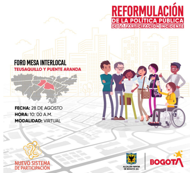
Ilustración 5. Pieza comunicacional – Foro mesa interlocal

De otro lado, en el marco de la reformulación de la política pública de participación incidente -PPPI, se realizaron los preparativos logísticos y operativos con el equipo territorial del IDPAC para el desarrollo del foro interlocal de participación. Para ello, se construyó la estrategia territorial de agenda pública y la pieza correspondiente.