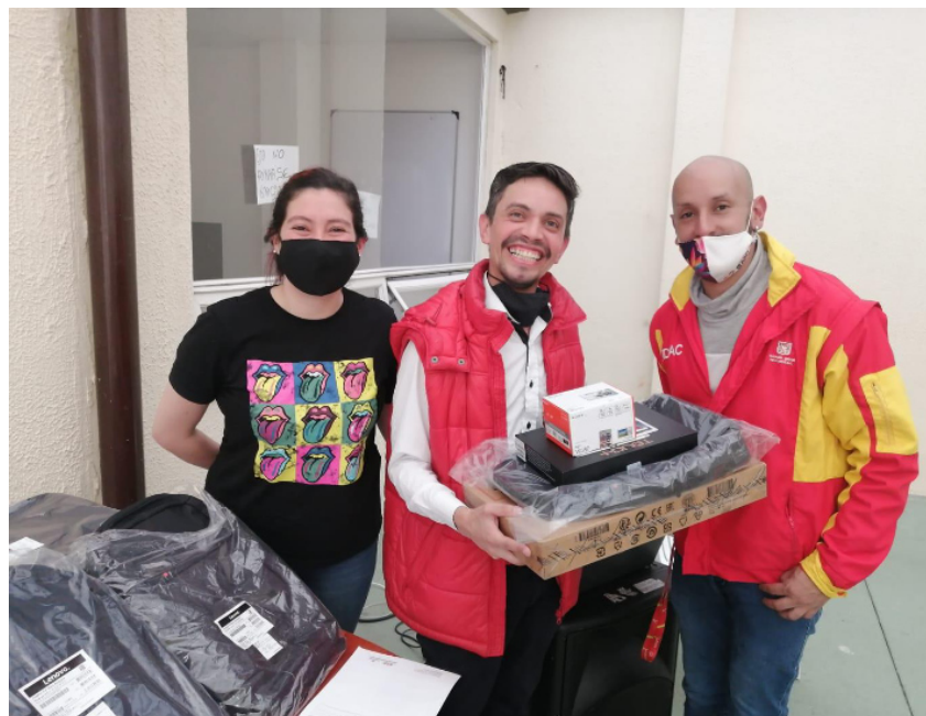
Fotografía 1. Entrega de Incentivo de fortalecimiento a la organización - Tres de Corazón.

Para estas organizaciones, se adelantaron actividades correspondientes a las etapas de caracterización y diagnóstico, plan de fortalecimiento, asistencia técnica, formación, incentivo de fortalecimiento y evaluación.