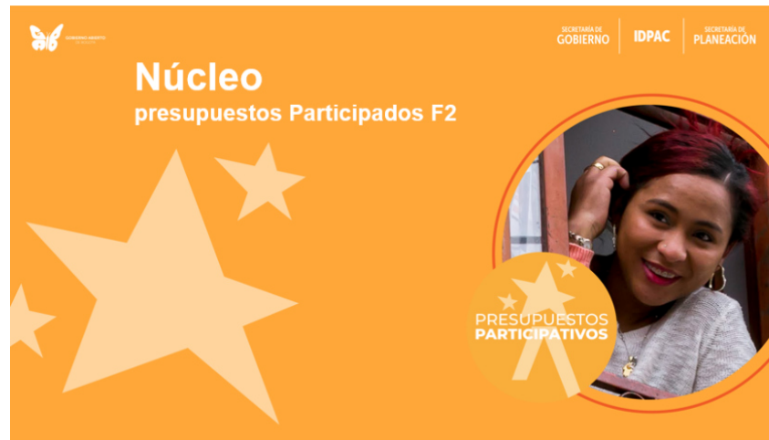
Anexo 15. Fortalecimiento instancias formales y no formales de participación

Se realizó el trabajo conjunto en el Centro de Atención a la Diversidad Sexual y de Género de Teusaquillo, para el apoyo técnico de un modelo en tres dimensiones digitales con respecto a la forma en que operará el nuevo centro, con el fin de coordinar la elaboración de un mural y el proceso de reinauguración.