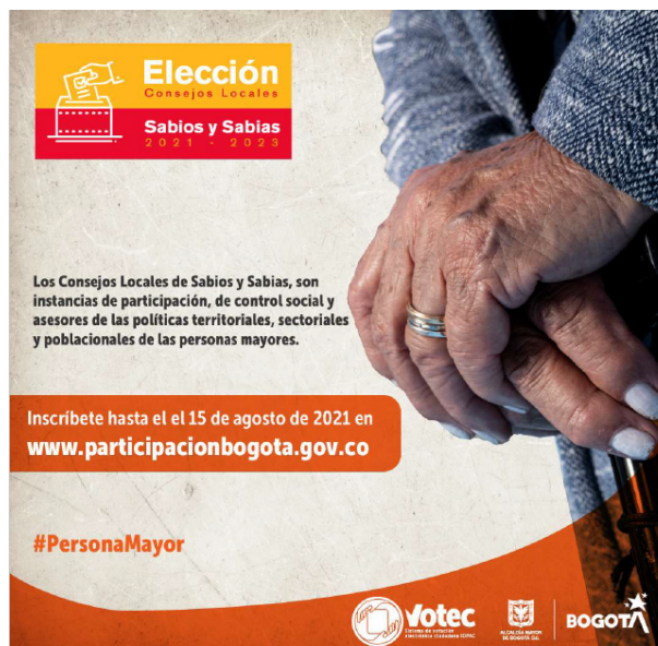
Ilustración 2. Consejos locales de Sabios y Sabias

Así mismo, se apoyaron los procesos eleccionarios de Consejos Locales de Sabios y Sabias para lo cual se realizó la inscripción de candidatos y votantes, y se llevó a cabo la revisión y subsanación de documentos.