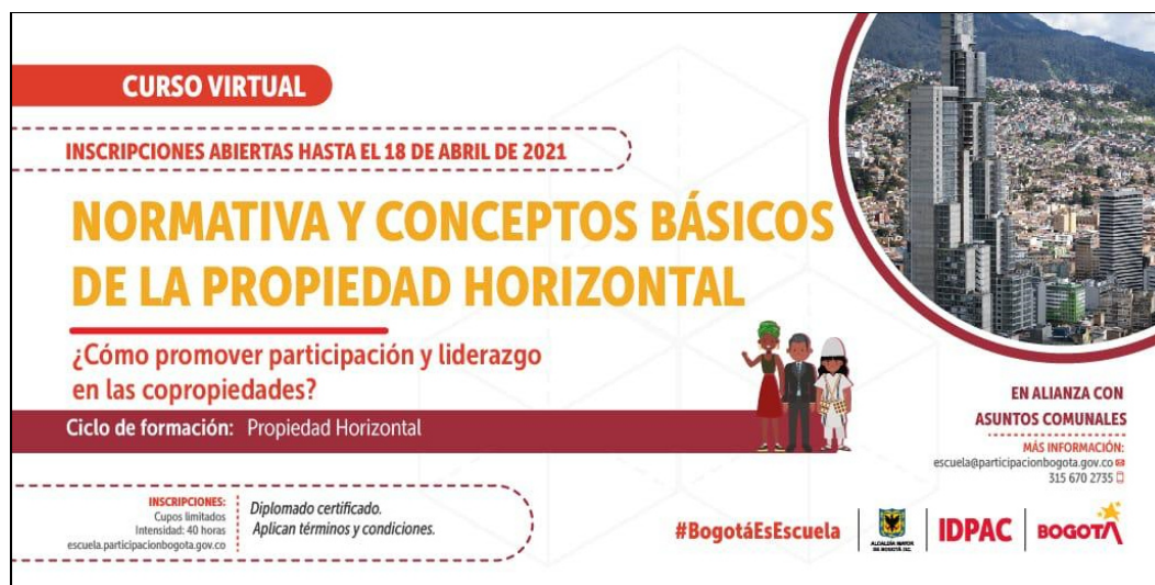
Ilustración 1. Curso Virtual Normativa Propiedad Horizontal