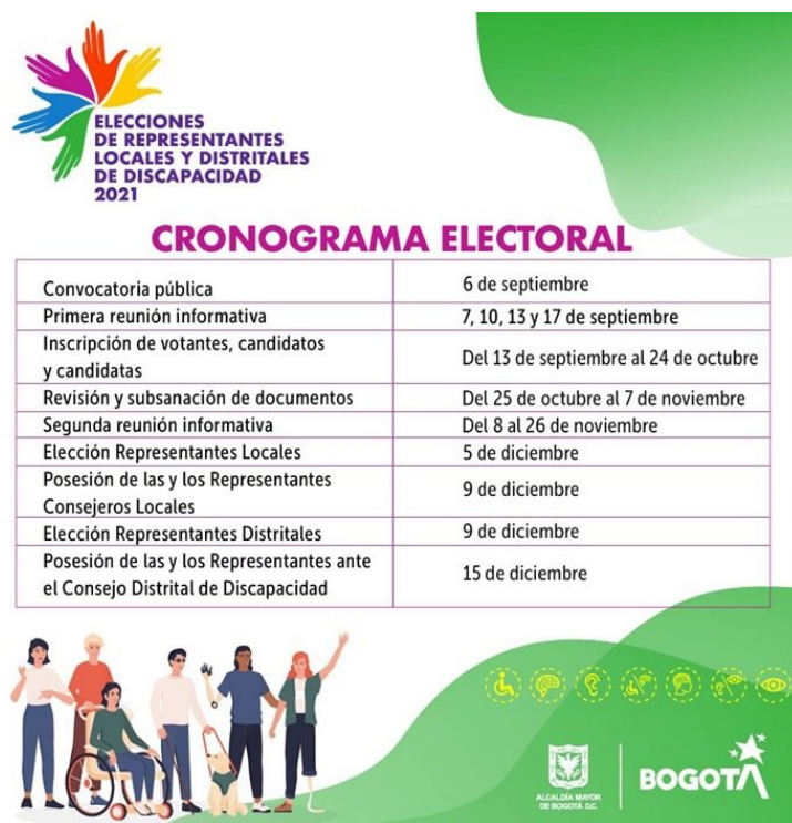
Anexo 11. Proceso eleccionario del Consejo Distrital de Discapacidad