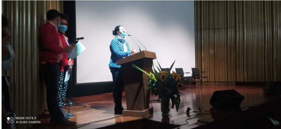
Fotografía 2. Primera Sesión de Mesa Periodo 2021 – 2023

Por otra parte, se brindaron garantías de los sectores de la localidad en condiciones de imparcialidad, igualdad y transparencia para el ejercicio de la participación a través del Sistema de Votación Electrónica Ciudadana (VOTEC). Este voto electrónico se realizó en el marco del proceso eleccionario del Consejo Local de Gestión del Riesgo y Cambio Climático, eliminando las barreras que implica la presencialidad, con canales de comunicación abiertos y seguridad informática adaptable a cualquier dispositivo, fomentando el interés de toda la ciudadanía en los ejercicios participativos.