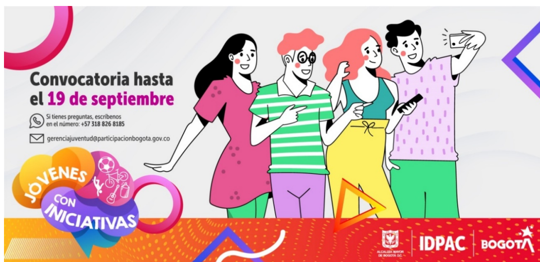
Ilustración 9. Convocatoria Jóvenes con iniciativas

https://www.participacionbogota.gov.co/jovenes-con-iniciativas-2021