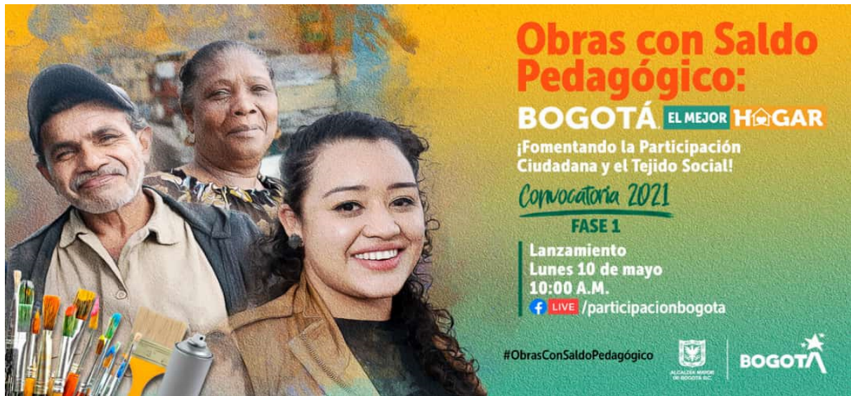
Ilustración 6. Pieza publicitaria Convocatoria OSP 2021

Se realizó el acompañamiento técnico y social para la entrega de las Obras con Saldo Pedagógico para el Cuidado y la Participación Ciudadana que resultaron seleccionadas en el proceso de convocatoria OSP 2021, como fruto de todo este proceso, se logró la entrega de las Obras con Saldo Pedagógico a las propuestas presentadas por la Junta de Acción Comunal - JAC - Nicolás de Federmán