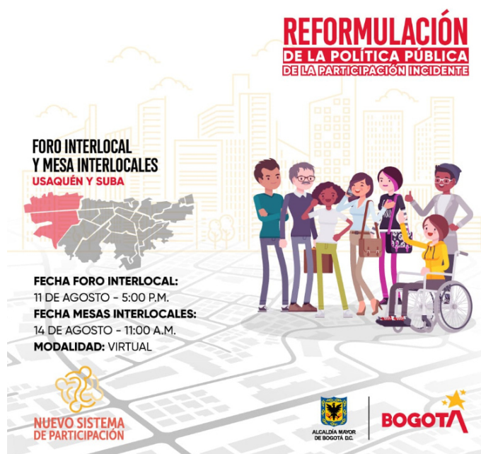
Ilustración 6. Pieza comunicacional – Foro mesa interlocal

Asimismo, en el marco de la política pública de participación incidente se realizaron mesas de trabajo para tratar temas como: Baja incidencia de la participación, Identificar las causas y los efectos del problema de la participación en la ciudad de Bogotá, entre otros.