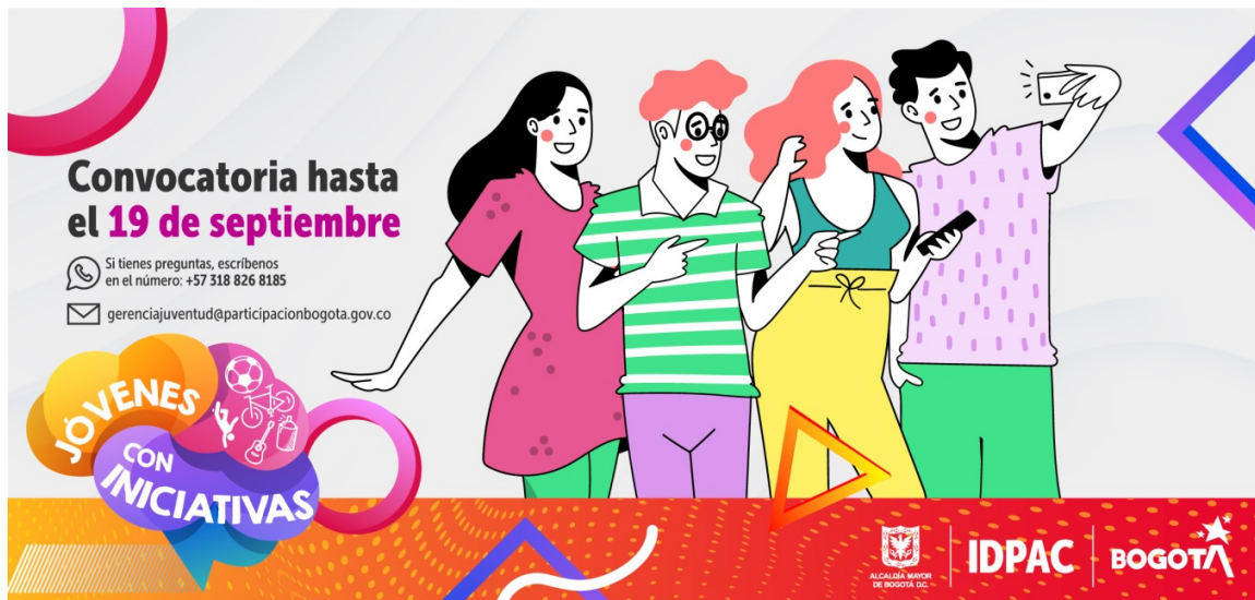
Ilustración 11. Convocatoria Jóvenes con iniciativas

https://www.participacionbogota.gov.co/jovenes-con-iniciativas-2021