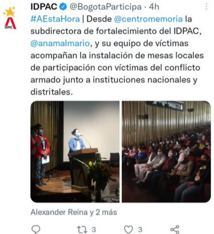
Ilustración 2. Instalación de mesas locales de participación de víctimas

Por otra parte, se brindaron garantías de los sectores de la localidad en condiciones de imparcialidad, igualdad y transparencia para el ejercicio de la participación a través del Sistema de Votación Electrónica Ciudadana (VOTEC). Este voto electrónico se realizó en el marco del proceso eleccionario del Consejo Local de Gestión del Riesgo y Cambio Climático, eliminando las barreras que implica la presencialidad, con canales de comunicación abiertos y seguridad informática adaptable a cualquier dispositivo, fomentando el interés de toda la ciudadanía en los ejercicios participativos.