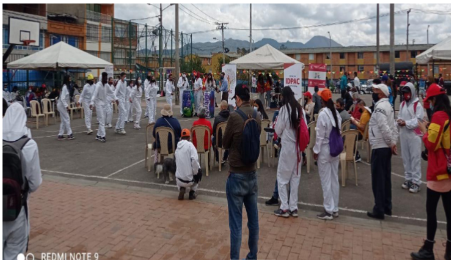
Anexo 29. Carrera de la participación que no es carreta

Se divulgó el portafolio de servicios del IDPAC en formación, promoción y fortalecimiento de la participación, entre los meses de abril y diciembre, los cuales permitieron a las diferentes organizaciones, ciudadanía y otros actores participar en los diferentes procesos y hacer uso de la oferta institucional como las elecciones locales al consejo de Sabios y Sabias, convocatoria a evento de IDPAC: "Bazar comunitario: La carreta de la participación que no es carreta" y demás oferta institucional.