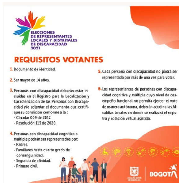
Anexo 17. Proceso eleccionario del Consejo Distrital de Discapacidad