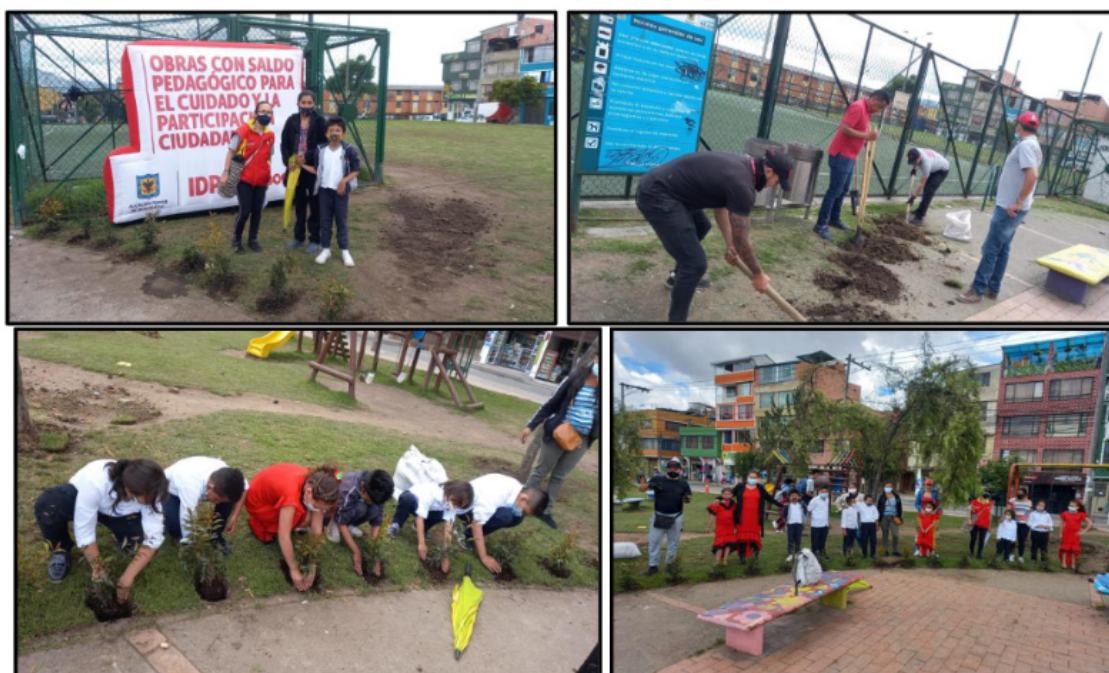
Anexo 26. Obras con Saldo Pedagógico – Sostenibilidad

Así mismo, el equipo de la gerencia de proyectos realizó el acompañamiento y asesoría virtual con las Juntas de Acción Comunal interesadas en la convocatoria de las OSP, con el fin de atender todas las dudas relacionadas con los términos de referencia, formatos de inscripción, anexos informativos y todo lo necesario para el ingreso al micrositio de la convocatoria en la página web del IDPAC, con el cual se disponen las herramientas necesarias para cargar los documentos y formatos de las propuestas que quedaron inscritas. Luego de las jornadas y reuniones realizadas por el equipo con las JAC, se logró la inscripción de 17 propuestas a la convocatoria Obras con Saldo Pedagógico: Bogotá, el mejor hogar 2021.