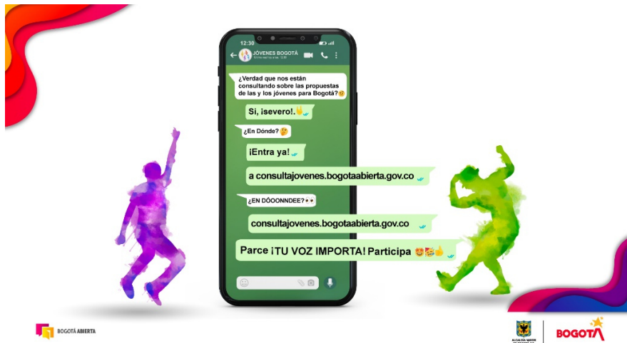
Ilustración 8. Consulta de Jóvenes – Tu voz importa

Del total de personas jóvenes que respondieron la consulta de la localidad, el 62,6% estuvieron de acuerdo en brindar el dato de su documento de identidad, de ellos el 21,9% declaró tener tarjeta de identidad y 50% con cédula de ciudadanía. La siguiente es la distribución etaria de acuerdo con rango de edad.