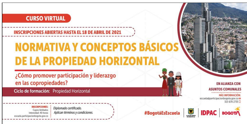
Ilustración 1. Curso Virtual Normativa Propiedad Horizontal