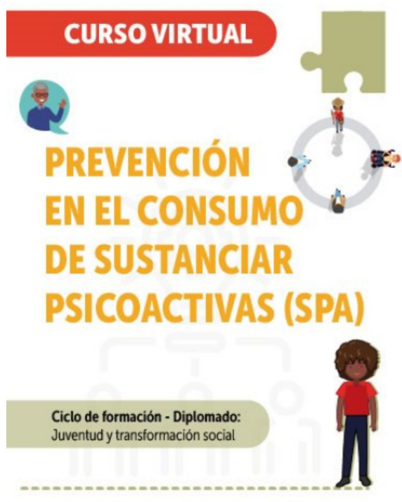
Ilustración 5. Pieza comunicacional – Curso virtual Prevención en el consumo de sustancias Psicoactivas - SPA

La Escuela de Participación cuenta con un plan de formación que determina los ciclos y cursos a desarrollar en cada vigencia. Para el 2021 se programó implementar 20 ciclos de formación que significa el desarrollo de 60 cursos de formación, para la localidad de la Teusaquillo participaron 3.946 personas en 54 cursos.