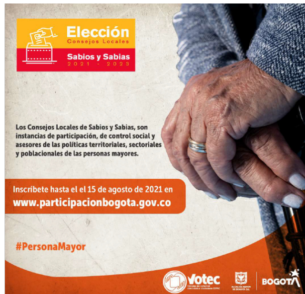
Anexo 16. Abecé elección Consejo Local de Sabios y Sabias

Finalmente, se apoyó la inscripción de candidatos y votantes que participarán en el proceso electoral del Consejo Distrital de Discapacidad - CDD.