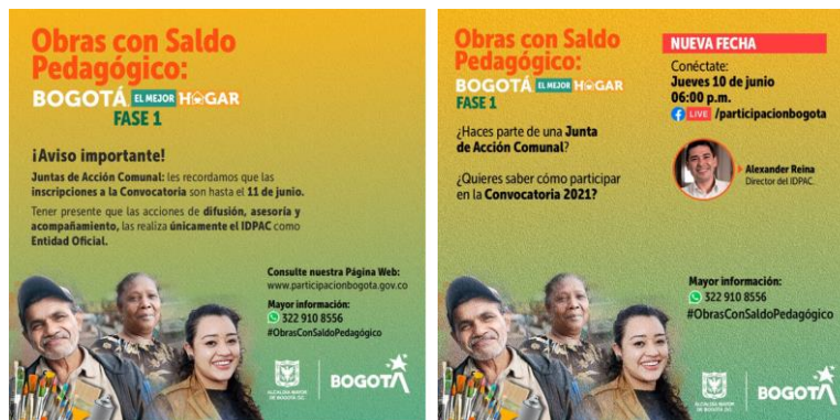
Ilustración 6. Pieza comunicacional – Obras con Saldo Pedagógico

Adicionalmente, se publicó oficialmente la convocatoria para las Obras con Saldo Pedagógico: Bogotá, el mejor hogar 2021, con la cual se estructuró una estrategia de difusión virtual y presencial, que estableció distintos canales de comunicación, atención y seguimiento a las dudas y preguntas de las Juntas de Acción Comunal y ciudadanía en general interesada en los términos de referencia, requisitos y etapas de la convocatoria. La estrategia de difusión se desarrolló hasta el 25 de junio y se llevó a cabo por equipos que se distribuyeron en 5 zonas de la ciudad, divididas equitativamente de manera que se pudiera extender la convocatoria y la información a todas las Juntas de Acción Comunal del Distrito Capital. Adicionalmente se publicaron diferentes piezas informativas digitales en las redes sociales y en el microsítio de la página oficial del IDPAC.