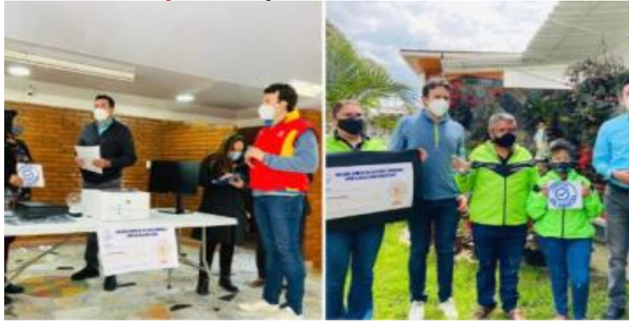
Fotografía 1. Entrega de Incentivos Juntas de Cristal