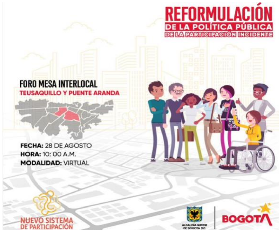
Anexo 28. Reformulación PPPI