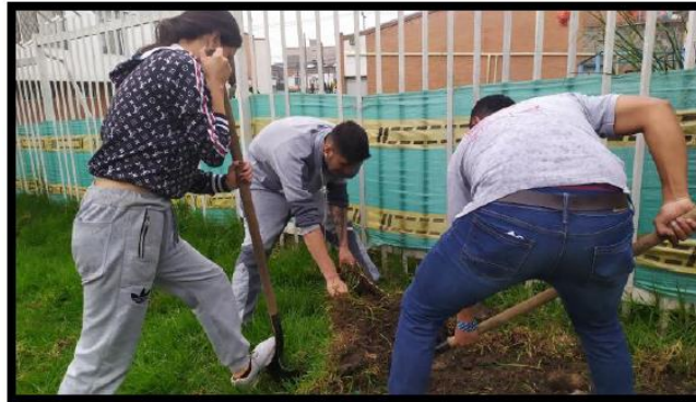
Fotografía 2. Acciones de sostenibilidad Villa Inés