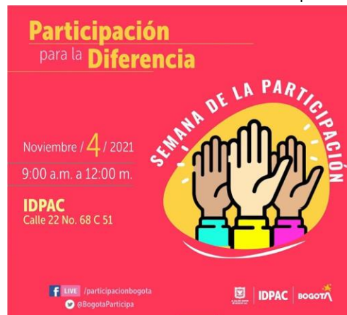
Ilustración 1. Taller Semana de la Participación

Para estas organizaciones, se implementaron las fases del modelo de fortalecimiento dentro de las cuales se resaltan las siguientes: caracterización, plan de fortalecimiento, asistencia técnica, formación, incentivo de fortalecimiento y evaluación, los incentivos se entregaron a través de convocatoria pública para que las Organizaciones participen.