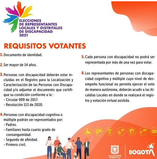
Anexo 20. Elección de representantes Locales y Distritales de Discapacidad 2021