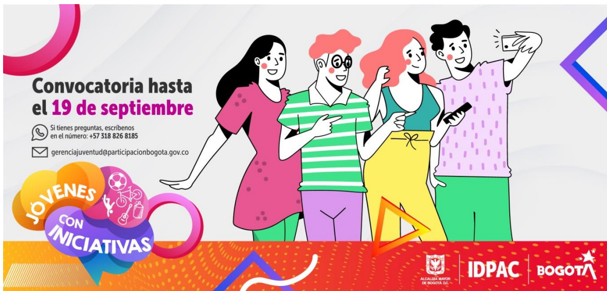
Ilustración 9. Convocatoria Jóvenes con iniciativas

https://www.participacionbogota.gov.co/jovenes-con-iniciativas-2021