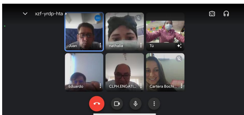
Fotografía 1. Edificio Liévano – Generalidades Ley 675 de 2001