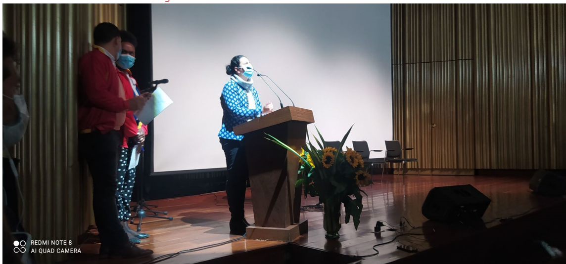
Fotografía 2. Primera Sesión de Mesa Periodo 2021 – 2023

Por otra parte, se brindaron garantías de los sectores de la localidad en condiciones de imparcialidad, igualdad y transparencia para el ejercicio de la participación a través del Sistema de Votación Electrónica Ciudadana (VOTEC). Este voto electrónico se realizó en el marco del proceso electoral del Consejo Local de Gestión del Riesgo y Cambio Climático, eliminando las barreras que implica la presencialidad, con canales de comunicación abiertos y seguridad informática adaptable a cualquier dispositivo, fomentando el interés de toda la ciudadanía en los ejercicios participativos.