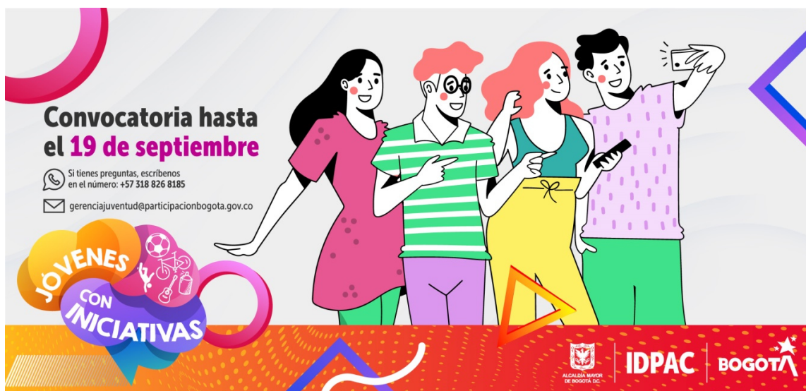
Ilustración 4. Convocatoria Jóvenes con iniciativas

https://www.participacionbogota.gov.co/jovenes-con-iniciativas-2021