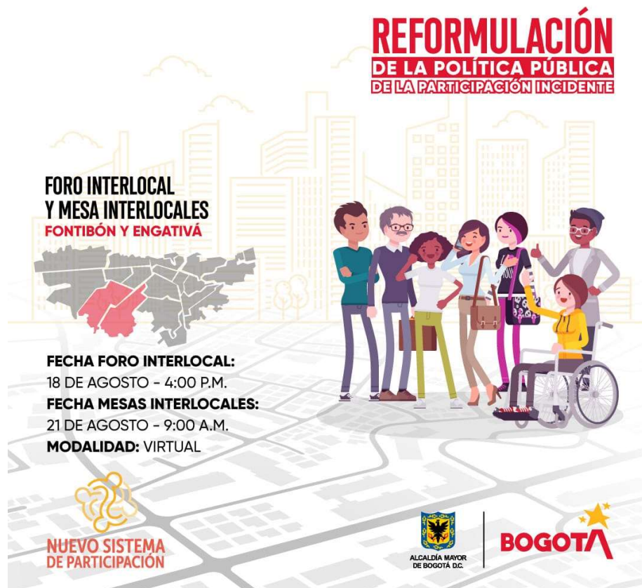
Ilustración 1. Pieza comunicacional – Foro mesa interlocal

De otro lado, en el marco de la reformulación de la política pública de participación incidente -PPPI, se realizaron los preparativos logísticos y operativos con el equipo territorial del IDPAC para el desarrollo del foro interlocal de participación. Para ello, se construyó la estrategia territorial de agenda pública y la pieza correspondiente del foro interlocal. Gracias a lo anterior, el 18 de agosto se llevó a cabo el foro y el 21 de agosto las mesas de trabajo virtuales