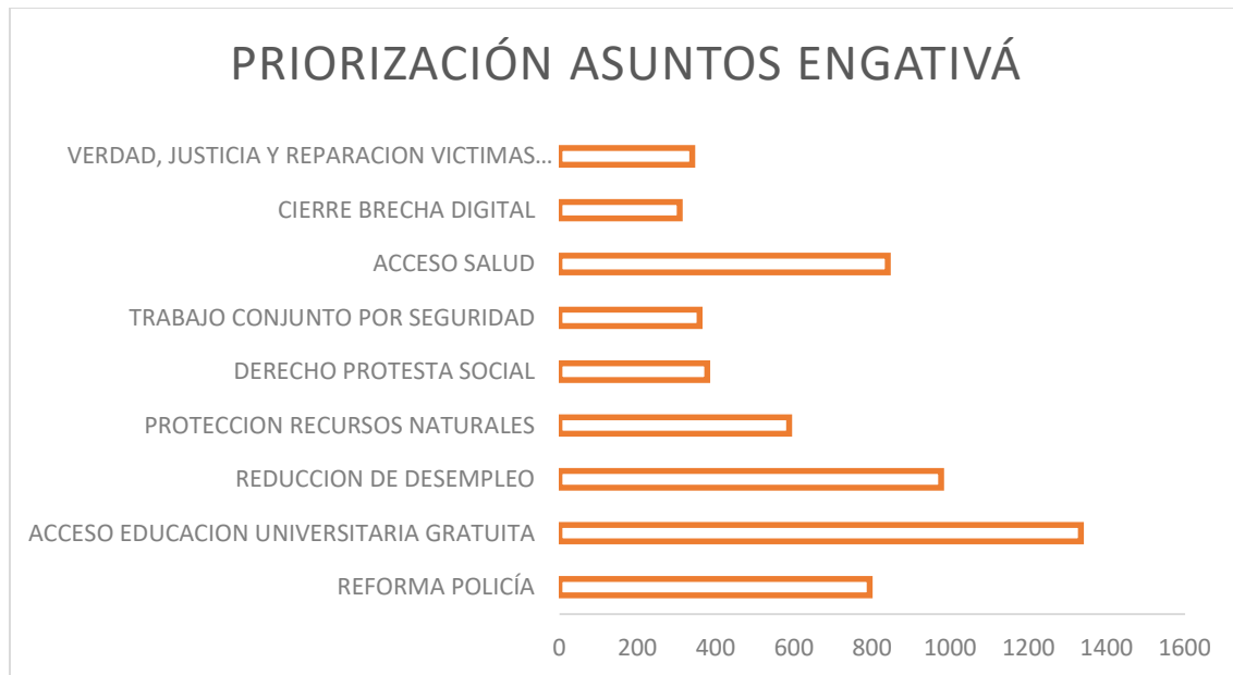
Ilustración 4. Priorización asuntos jóvenes consultados residentes en Engativá

En este sentido, los asuntos que fueron ubicados en el primer lugar por parte de los jóvenes que declararon residir en la localidad de Engativá son los siguientes: