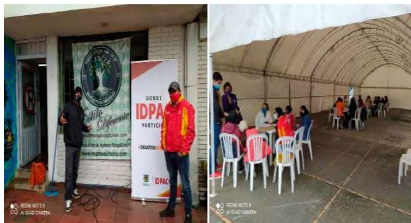
Anexo 27. Estrategia de divulgación