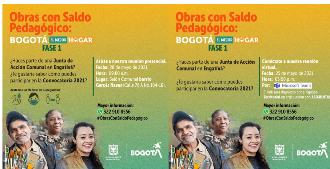
Ilustración 2. Pieza comunicacional – Obras con Saldo Pedagógico

Luego de las jornadas y reuniones realizadas por el equipo con las JAC de la localidad de Engativá, se logró la inscripción de 23 propuestas a la convocatoria Obras con Saldo Pedagógico: Bogotá, el mejor hogar 2021.