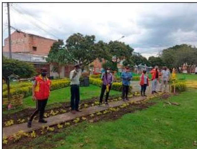
Fotografía 4. Acciones de sostenibilidad Parque La Palestina

Adicionalmente, se publicó oficialmente la convocatoria para las Obras con Saldo Pedagógico: Bogotá, el mejor hogar 2021, implementando la estrategia de difusión virtual y presencial y los diferentes canales de comunicación, atención y seguimiento a las dudas y preguntas de las Juntas de Acción Comunal y ciudadanía en general interesada en participar de esta convocatoria. La estrategia de difusión se desarrolló hasta el 25 de junio y se llevó a cabo en cinco (5) zonas de la ciudad, adicionalmente se publicaron diferentes piezas informativas digitales en las redes sociales y en el microsítio de la página oficial del IDPAC.