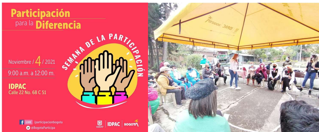
Fotografía 3. Taller Semana de la Participación

Para estas organizaciones, se implementaron las fases del modelo de fortalecimiento dentro de las cuales se resaltan las siguientes: caracterización y diagnóstico, plan de fortalecimiento, asistencia técnica, formación, incentivo de fortalecimiento y evaluación, los incentivos se entregaron a través de convocatoria pública para que las Organizaciones participen.