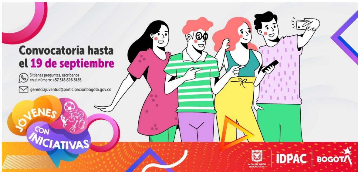
Ilustración 5. Convocatoria Jóvenes con iniciativas

https://www.participacionbogota.gov.co/jovenes-con-iniciativas-2021