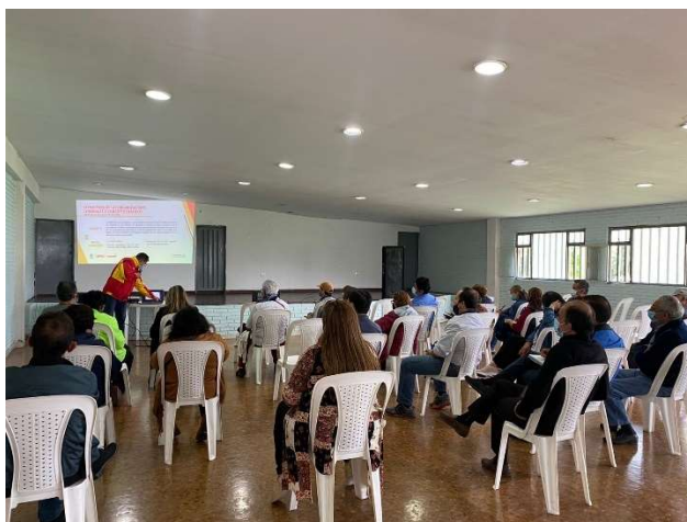
Fotografía 2. Capacitaciones elecciones comunales