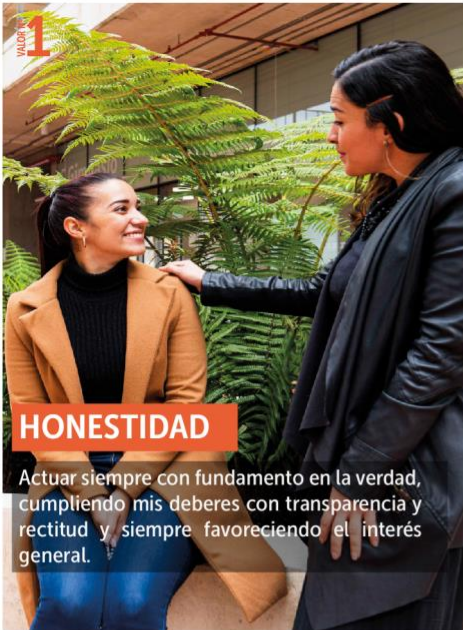
Ilustración 2: Valores del Servicio Público