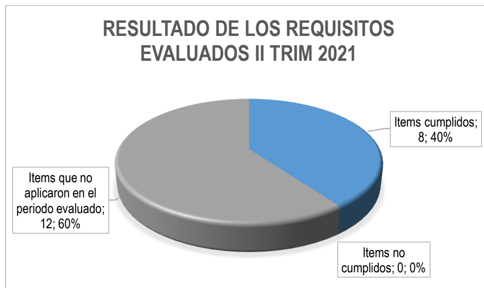
Gráfica: 1 Fuente: elaboración propia OCI

De acuerdo al alcance definido, la OCI verificó 20 ítems o requisitos de la norma, los cuales fueron valorados como se presenta en el siguiente gráfico: